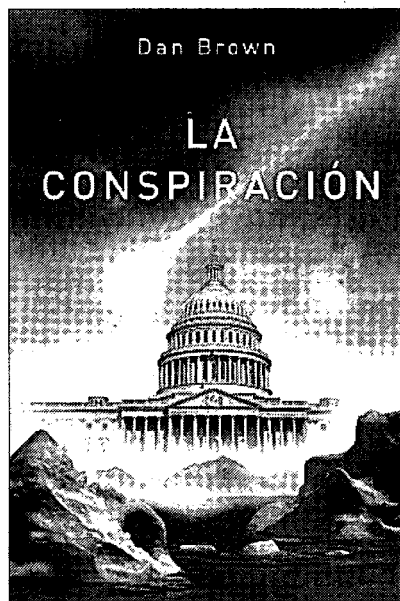
►► Portada del libro.

En esta novela popular, con elementos de buen suspense político y toques de ciencia ficción, Brown se aleja de las intrigas esotéricas y papales, y se decanta por una trama de